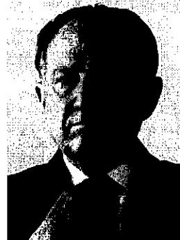
El general Félix Sanz

Pero la reestructuración no sólo ha consistido en cambiar caras. El centro dispone ahora de un nue-