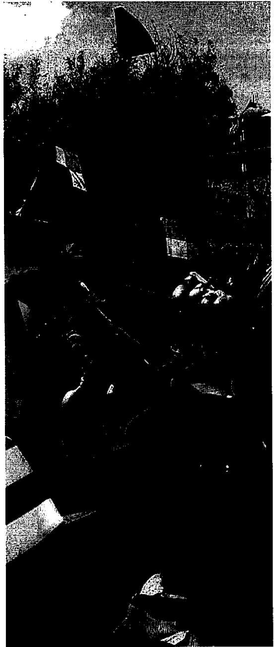
Bolivianos celebran la nacionalización de los hidrocarburos en 2006.